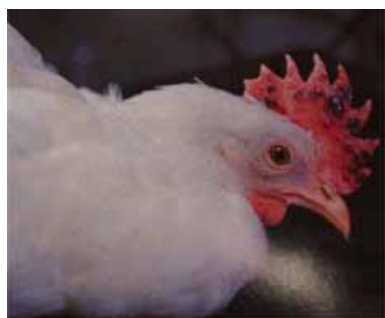
ウイルスに感染したニワトリ

家畜伝染病予防法に基づき、農場への立ち入りを制限するとともに、飼育場の消毒を実施しています。また、半径10km圏内で飼育されている家禽類 かきんるい の移動を禁止しました。さらに同年3月4日には、5km離れた農場から2例目の発生が確認され、3月10日には、この2例目に発生が確認された農家より雛の出荷を受けていた農家から3件目の検出が確認されました。