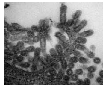
鳥インフルエンザウイルスの 電子顕微鏡写真

鳥インフルエンザは2004年に山口県の養鶏場で確認され、その後、京都府・茨城県・宮城県などの養鶏場でも発生が確認されました。また、ハシブトガラスやクマタカ、オオハクチョウなどの野鳥からも検出されました。ウズラに鳥インフルエンザ感染が確認されたのは国内初であり、さらに中部地方で鳥インフルエンザへの感染が発見されたのも初めてです。愛知県および農林水産省は、