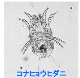
コナヒョウヒダニ